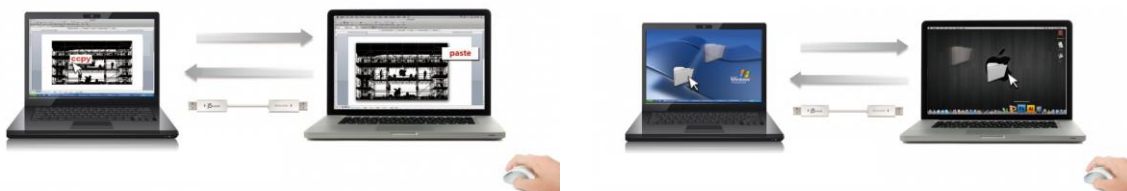
[コピーアンドペーストのイメージ]

wormhole switch で接続された 2 台の PC 間で、コピーアンドペースト、ドラッグアンドドロップによるデータ移動が可能。写真や動画といった大容量のデータでも、外部ストレージに移したり、ネットワークに接続することなく、ストレスフリーで転送ができます。