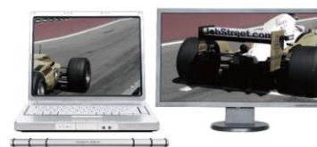
[プライマリーモード]