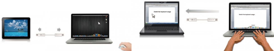
[マウスの共有のイメージ]

wormhole switch で接続された 2 台の PC 間で、マウス操作、キーボード入力がどちらからでも操作できます。片方のマウス、キーボードで両方の PC 操作が可能です。しかも、異なる OS 間での共有もサポート。Windows ⇄ mac 間での共有も可能です。