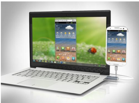
[スクリーンミラー機能]

USB 接続したアンドロイドスマートフォン、アンドロイドタブレット端末の画面がそのまま PC のディスプレイにミラー表示できます。表示された画面の拡大、縮小も可能。スマホ、タブレットの動きに連動した回転表示機能も搭載しています。