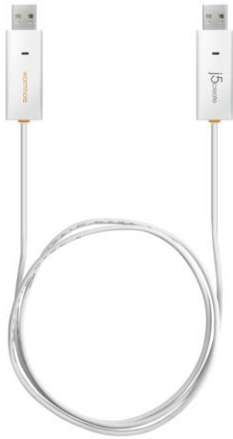
価格 2,980 円(税込) ※参考店頭販売価格