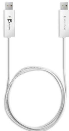
価格 1,980 円(税込) ※参考店頭販売価格